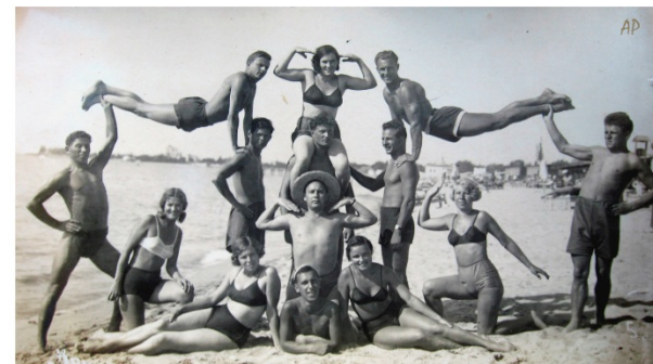
Евпатория. 1937 год