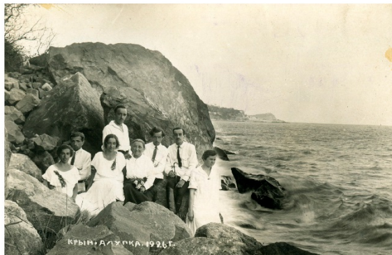
Алупка. 1926 год