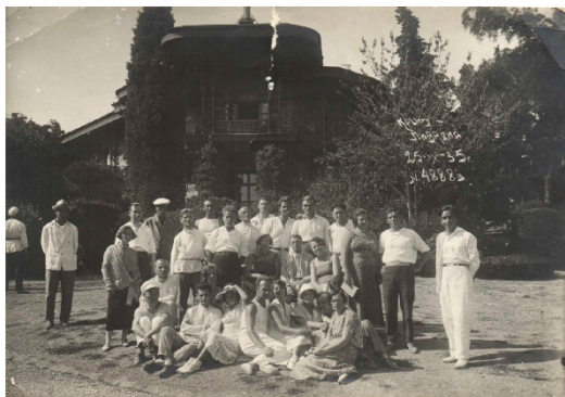
Ливадия. 25 октября 1935 года